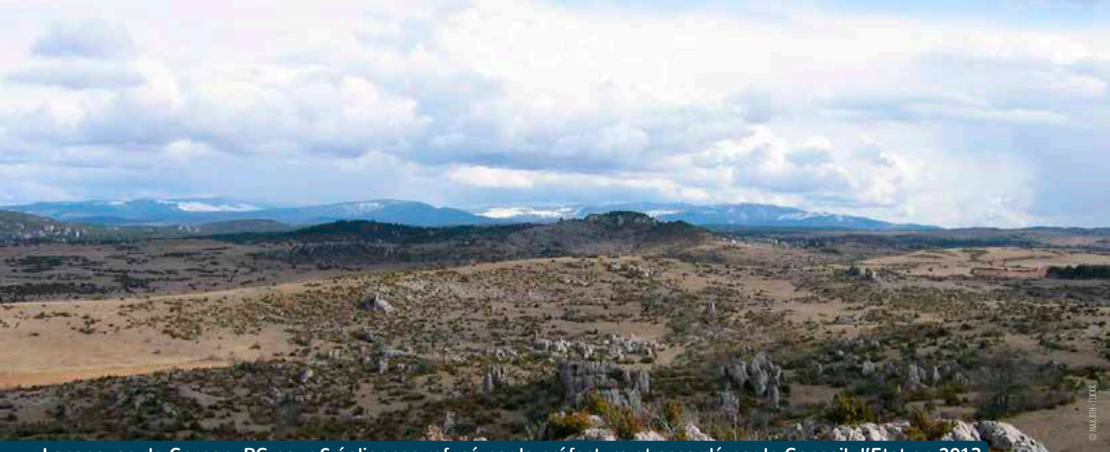
Lapanouse de Cernon, PC pour 6 éoliennes refusé par la préfecture et accordé par le Conseil d'Etat en 2013