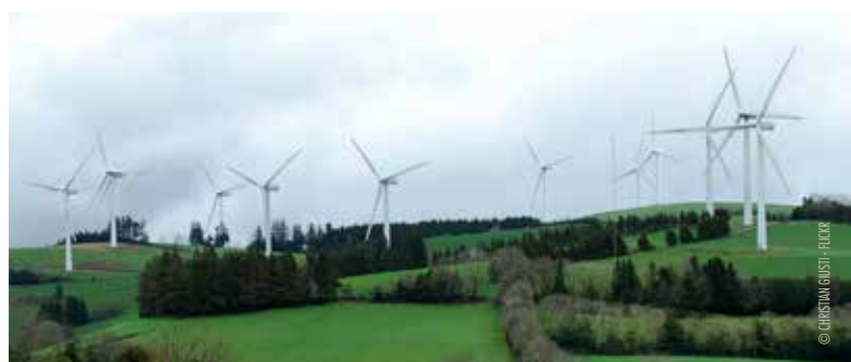
Le charmant bocage industriel de Murat sur Vèbre