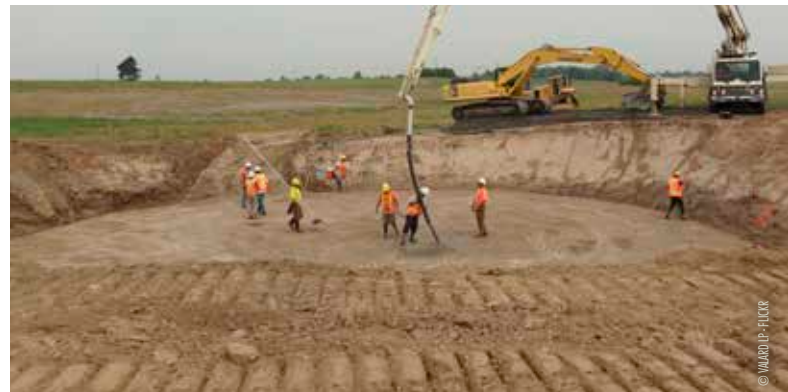
Fondations d'une éolienne de 2 MW

* taxe prélevée sur la facture des ménages, composée à 59% du «surcoût lié aux énergies renouvelables», et à 28% du «surcoût de production de l'électricité».