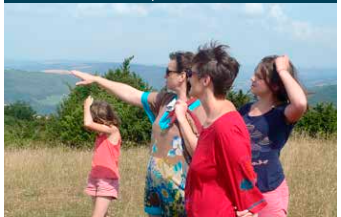
Les touristes, une espèce menacée d'extinction

Les Parcs Naturels Régionaux quant à eux se sacrifient sur l'autel de « l'expérience industrielle pour le bien de la planète »; un sublime élan qui ne peut être qu'humaniste.