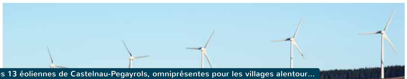
Les 13 éoliennes de Castelnau-Pegayrols, omniprésentes pour les villages alentour...

400 m3 de béton (800T, ou 50 camion-toupies) + 45 T de ferrailage. Le démantèlement prévoit d'araser et de recouvrir de terre. Tant pis pour les agriculteurs et les orchidées.