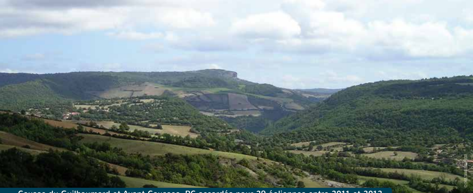
Causse du Guilhaumard et Avant-Causse, PC accordés pour 29 éoliennes entre 2011 et 2012