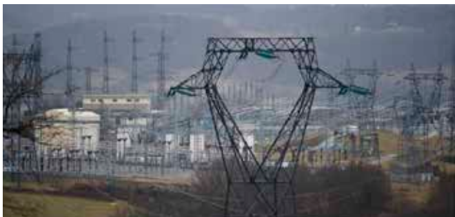
A Rueyres, un avant-goût du tranfo de St Victor

Dans cet élan, les centrales éoliennes ont été implantées sans même s'assurer des réseaux de transport nécessaires pour évacuer l'électricité. Des infrastructures lourdes, transformateurs et lignes très haute tension (THT), devront être construites à grand frais à travers le pays.