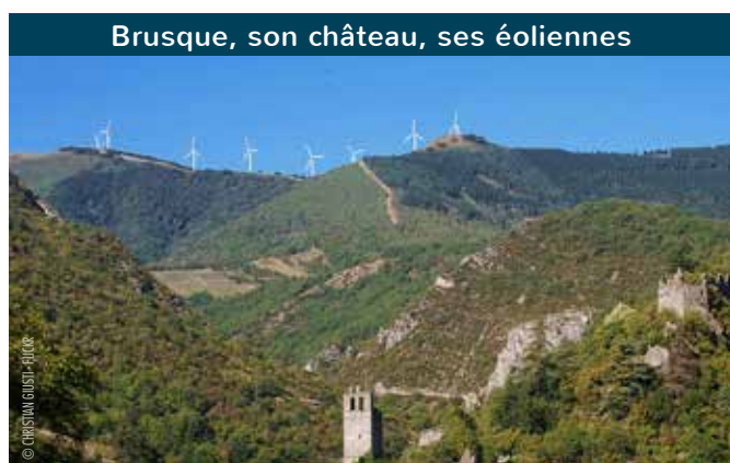
Brusque, son château, ses éoliennes