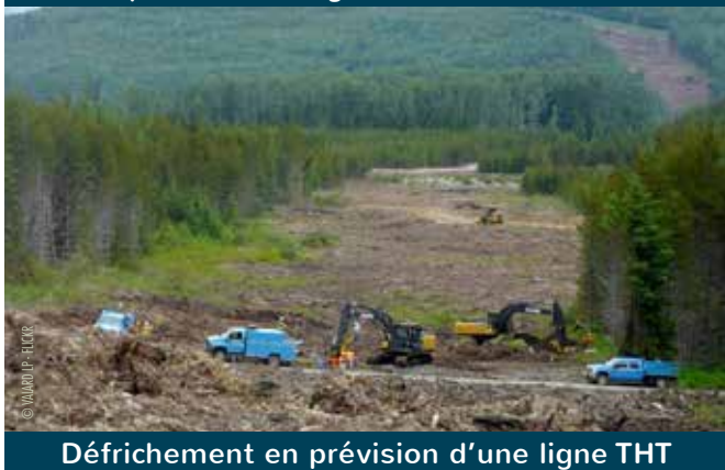
Défrichage en prévision d'une ligne THT

À Saint Victor et Melvieu, au coeur de magnifiques terrains agricoles classés AOP, malgré l'opposition des jeunes fermiers et de la population, un méga-transformateur, clef de voûte du dispositif, devrait bientôt voir le jour sur 7 hectares. Capable de transporter l'énergie de 800 éoliennes, ce transformateur surdimensionné préfigure-t-il le nombre de machines restant à implanter en Aveyron, contrairement aux affirmations des élus, ou est-il un simple gaspillage financier ?