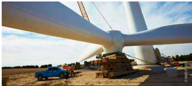
Eolienne Puissance 2 MW

À Saint Victor et Melvieu, au coeur de magnifiques terrains agricoles classés AOP, malgré l'opposition des jeunes fermiers et de la population, un méga-transformateur, clef de voûte du dispositif, devrait bientôt voir le jour sur 7 hectares. Capable de transporter l'énergie de 800 éoliennes, ce transformateur surdimensionné préfigure-t-il le nombre de machines restant à implanter en Aveyron, contrairement aux affirmations des élus, ou est-il un simple gaspillage financier ?